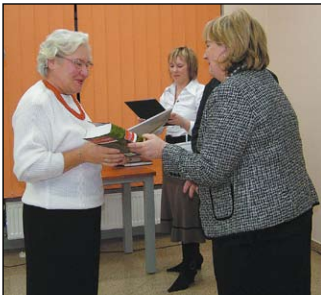
Najwytrwalszym czytelnikom zostały wręczone nagrody