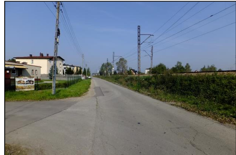
Fot. 8 Ul. Klonowa, wschodnia część obszaru