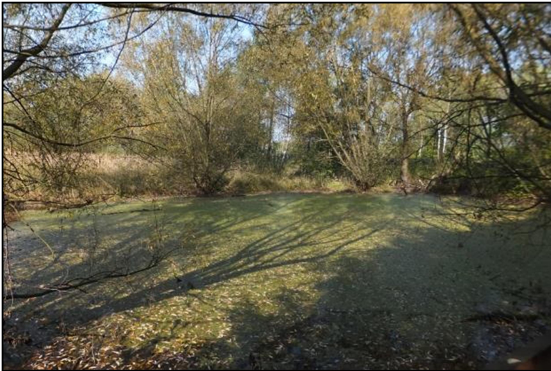
Fot. 2 Niewielki staw w rejonie ul. M. Drzymały