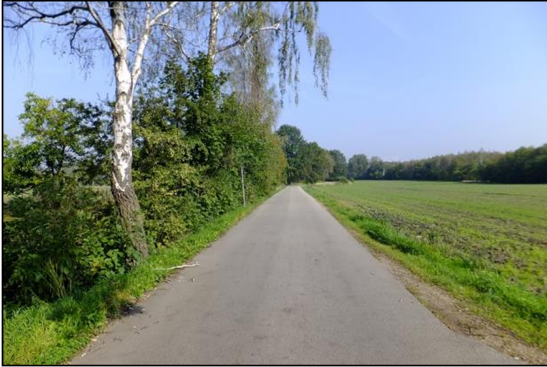
Fot. 1 Ul. Leśna, centralna część obszaru