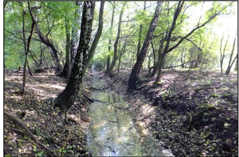
Fot. 4 Doptyw spod Nowej Gaci