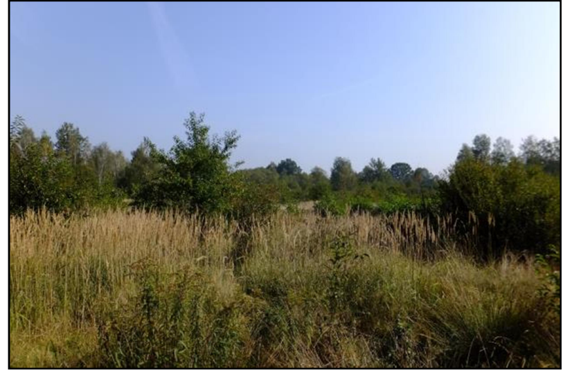
Fot. 3 Odłogowane tereny rolne w północno-zachodniej części obszaru