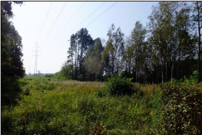
Fot. 6 Zadrzewienia o charakterze ruderalnym w północno-wschodniej części obszaru