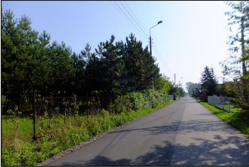
Fot. 5 Ul. M. Drzymały