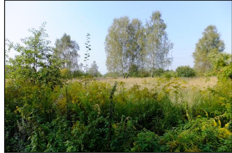
Fot. 7 Teren o charakterze ruderalnym, wschodnia część obszaru, widok z ul. Klonowej