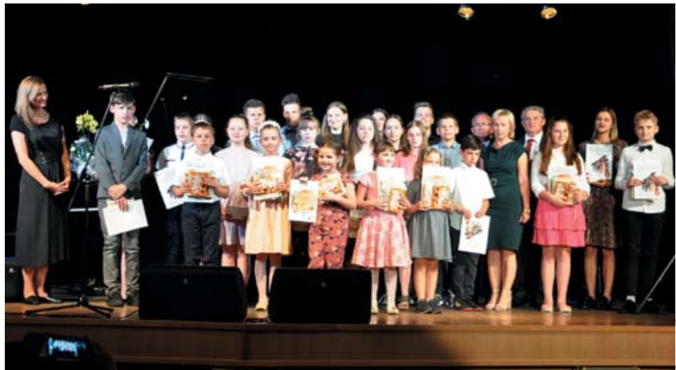
Po koncercie jego uczestnicy ustawili się do wspólnego zdjęcia.