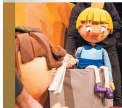
KRÓL MACIUSZ (OI Teatr) - Bajka dla dzieci 20 lutego 2022 | godz. 16.00 bilety w cenie 5,00 zł dostępne od 6.01