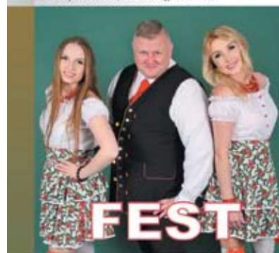
BABSKI COMBER Z GRUPĄ FEST 27 lutego 2022 | godz. 17.00 bilety w cenie 20,00 zł dostępne od 6.01