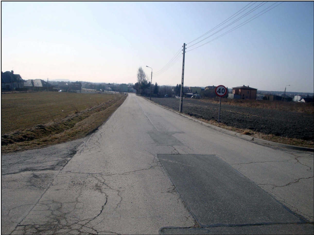
Zdjęcie nr 1. Tereny planu w części południowej (po lewej stronie) wraz z otoczeniem (po prawej stronie).

Analiza stanu środowiska przyrodniczego obszaru opracowania została przygotowana w oparciu o wyniki analiz zebranych materiałów i informacji dot. stanu środowiska miasta Imielin oraz na podstawie obserwacji terenów objętych sporządzeniem planu. Miejscowy plan zagospodarowania przestrzennego obejmuje obszar o powierzchni 133,38 ha położony w rejonie ul. Wyzwolenia, Ściegiennego, Poniatowskiego i Nowozachęty – w północnej części miasta.