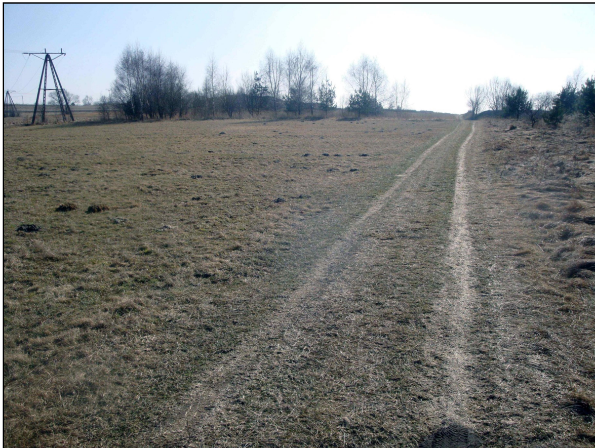
Zdjęcie nr 3. Tereny rolnicze w części północnej obszaru opracowania.

leśnymi. Sieć hydrograficzną miasta Imielin tworzą również liczne rowy melioracyjne o łącznej długości około 20 km. Ponadto na terenie miasta znajduje się Zbiornik Imieliński (Dzieńkowice) o powierzchni 712 ha, będący źródłem zaopatrzenia w wodę mieszkańców oraz przedsiębiorstw na terenie województwa śląskiego. Zbudowany został w miejscu wyrobiska po wyeksploatowanych piaskach posadzkowych. Jedynym elementem sieci hydrograficznej analizowanego obszaru jest fragment rowu melioracyjnego usytuowanego w części południowo-wschodniej. Tereny w granicach opracowania należą do zlewni Imielinki. Obszar opracowania znajduje się poza terenami zaliczonymi do obszarów narażonych na niebezpieczeństwo powodzi oraz, na których wystąpienie powodzi jest prawdopodobne.