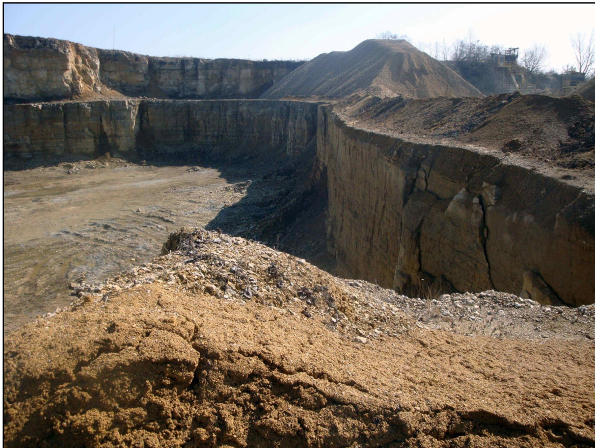
Zdjęcie nr 2. Widok na teren zakładu górniczego.

Pod względem morfologicznym wschodnia i południowa część Imielina należy do Doliny Przemszy, należącej do Kotliny Mysłowickiej stanowiącej denudacyjne obniżenie wypełnione osadami czwartorzędowymi i trzeciorzędowymi. Występujące w tej części miasta zrębowe Pagóry Imielińskie są wydłużonymi w kierunku równoleżnikowym wzgórzami zbudowanymi z utworów triasowych, oddzielone od siebie głębokimi dolinami powstałymi w strefach uskoków tektonicznych.