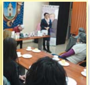
Pokaz dla pań