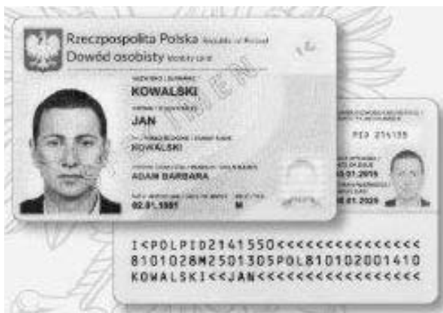
Wzór nowego dowodu osobistego.

Urząd Stanu Cywilnego w Imielinie jest właściwy, jak dotychczas, dla rejestracji urodzeń, małżeństw i zgonów, które miały miejsce w gminie Imielin. Natomiast w nowej ustawie określono, iż odpisy aktów stanu cywilnego pobrać można w każdym urzędzie stanu cywilnego na terenie kraju, niezależnie od tego, gdzie nastąpiło urodzenie, zgon czy zawarcie małżeństwa. Np.: osoba urodzona w Warszawie odpis