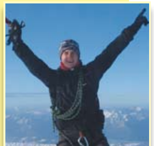
Imielok na krańcu świata