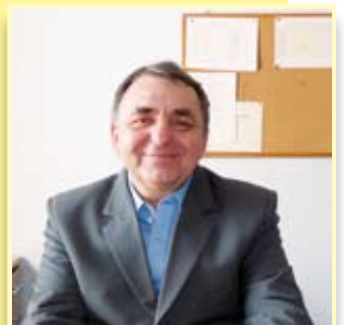
„Pogoń” ma nowego prezesa