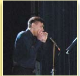
Talent z Imielina