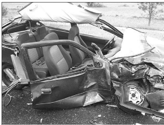
Oby takich zdarzeń w Imielinie było jak najmniej.

Miasto stara się zapobiegać przestępstwom wspierając po-