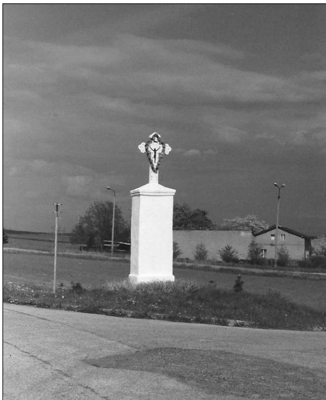
W tym miejscu podobno działa się niezwykle zdarzenia.

W tym momencie w blasku płonącej świeczki zobaczył rękę która wysunęła się zza postumentu i zabrała palącą świeczkę. Chłopak pomyślał że ktoś robi mu kawał, wziął swoją świeczkę i obiegł krzyż. Dookoła nikogo jednak nie było, zapanowało totalna ciemność. Jego siostry stały dwa metry od krzyża. Cała trójka