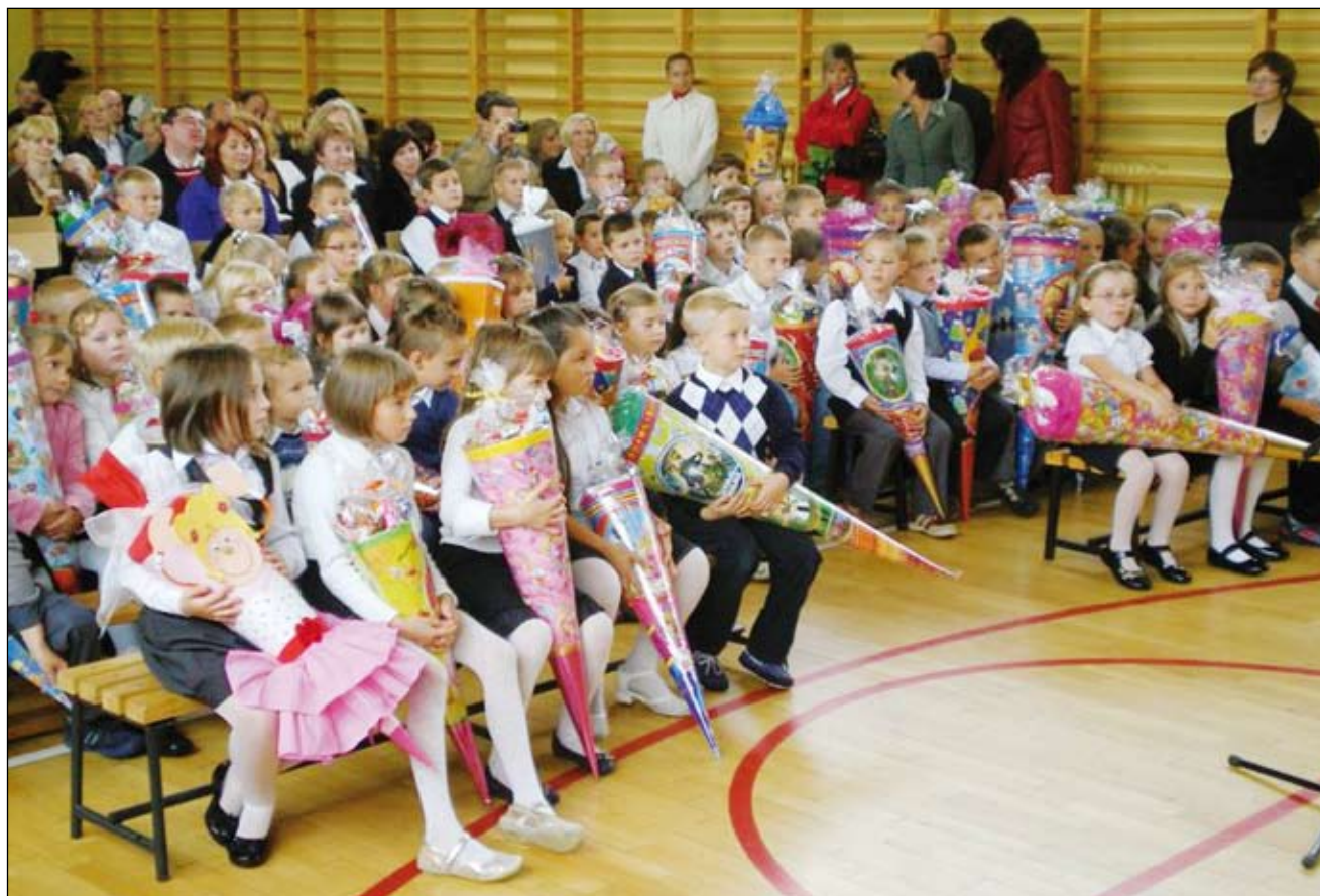
Początek roku szkolnego w Szkole Podstawowej w Imielinie.

N owory rok szkolny w Szkole Podstawowej w Imielinie przywitało 495 uczniów. Mimo doniesień o niuż demograficznym i zmniejszaniu się liczby dzieci w szkołach, w naszej podstawówce nie zmniejsza się ich liczba. Świadczy to o tym, że jest dobrze oceniana w środowisku. Dzisiejsza szkoła ma być przyjazna uczniowi, otwarta na problemy wychowanków, sprawiedliwa w ocenach. Rodzice są partnerami szkoły i pierwszymi nauczycielami swoich dzieci, dlatego cenne jest ich zaangażowanie w szkolne sprawy.