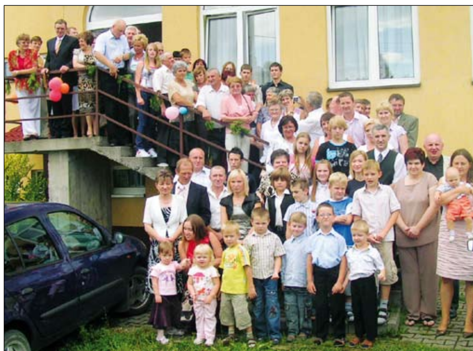
Ponad sto osób wzięło udział w rodzinnym zjeździe Stolarczyków.

Po mszy wszyscy spotkali się w restauracji w Chełmie Śl., bo tylko tam okazało się, że jest wolne miejsce. Tak liczna rodzina, w dodatku rozproszona jest po kraju i świecie, dopiero tutaj miała okazję spotkać się i poznać bliżej. - Taki zjazd daje ku