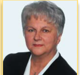
Radna ocenia kadencję