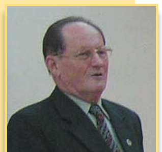
Prezesuje od 20 lat