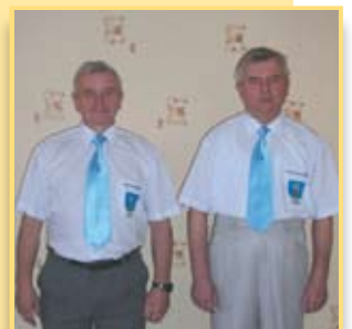
Pojechali do RPA