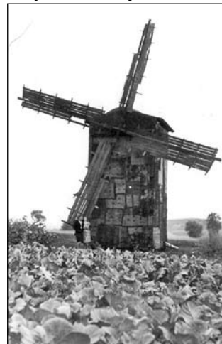
Dawny wiatrak Skrzypulców na ulicy Maratońskiej