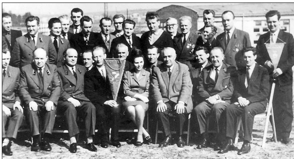
Zarząd byłej piaskowni na ulicy Maratońskiej

Dawne nazwy tej ulicy to: Długa i Dachsweg (Dachs – borsuk)