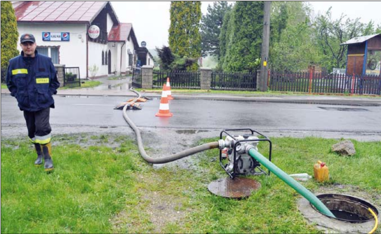
Pompowanie wody z kanalizacji deszczowej do Imielanki. 17 maja na ul. Brata Alberta.

W porównaniu do innych gmin Imielin wyszedł z tegorocznej powodzi niemal bez szwanku. Największą uciążliwością dla mieszkańców były zalewane piwnice – taką dolegliwość odczuło ok. 80% mieszkańców. Przyczyną był nadmiar wód gruntowych, które nie potrafiły znaleźć ujścia.