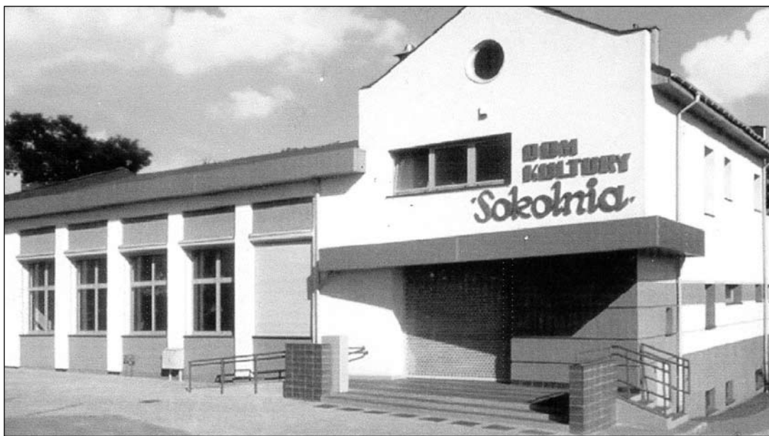
Sokolnia powstała w miejscu Stalicznej Górki