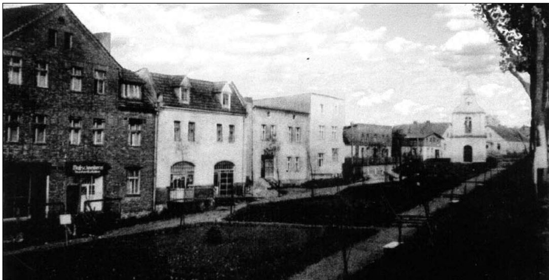
Centrum Imielina w czasie II wojny światowej

Przy ul. Hallera znajduje się PHU „Metale”, gdzie odbywają się Targi Przedsiębiorczości, znajduje się tam także Wytwórnia Farb i Lakierów. Obok znajduje się stadion sportowy „Pogoń” Imielin. Na rogu ul. Hallera i P. Skargi stoi ciekawy krzyż przydrożny z 1901 roku fundacji rodziny Kramarczyk. Na wysokim postumencie u stóp krzyża znajdują się figury Matki Boskiej Bolesnej i św. Jana Ewangelisty.