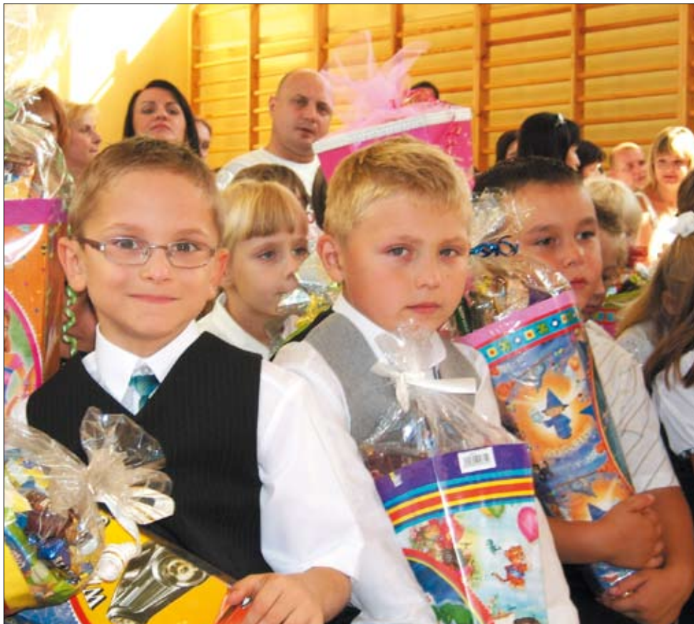
Pierwszoklasiści z Imielina na rozpoczęciu roku szkolnego.

W imielińskim gimnazjum naukę rozpoczęło 1 września 260 uczniów (107 dziewczyny i 153 chłopców). Szkoła liczy 12 oddziałów (po cztery klasy w każdym roczniku). Uczniowie