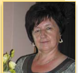
Dla dobra mieszkańców