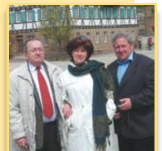
Chór Harfa w Enzkreis