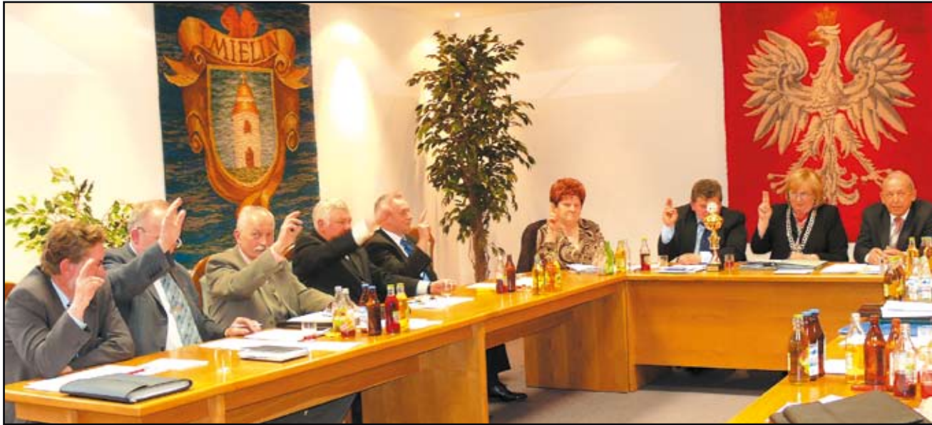
Radni podczas głosowania na sesji 25 kwietnia