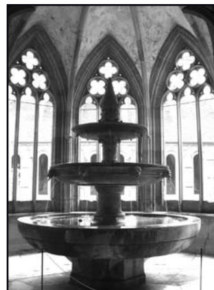
„Maulbronn” pochodzi też od „źródła”

stety nie na naszą kieszeń), połączonym samochodem porsche i ciekawymi multimedialnymi prezentacjami poświęconymi np. diamentom i innym cennym minerałom. Nie darmo Pforzheim bywa nazywane Złotym Miastem (Goldstadt). Od średniowiecza rozwijało się tutaj rzemiosło złotnicze, jubilerskie, a także przemysł