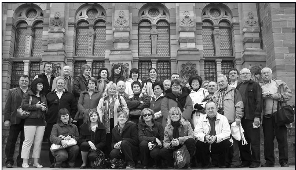
Imielińska Harfa przed zamkiem w Heidelbergu