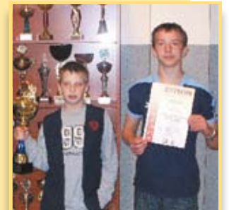
Rosną szachowe sławy