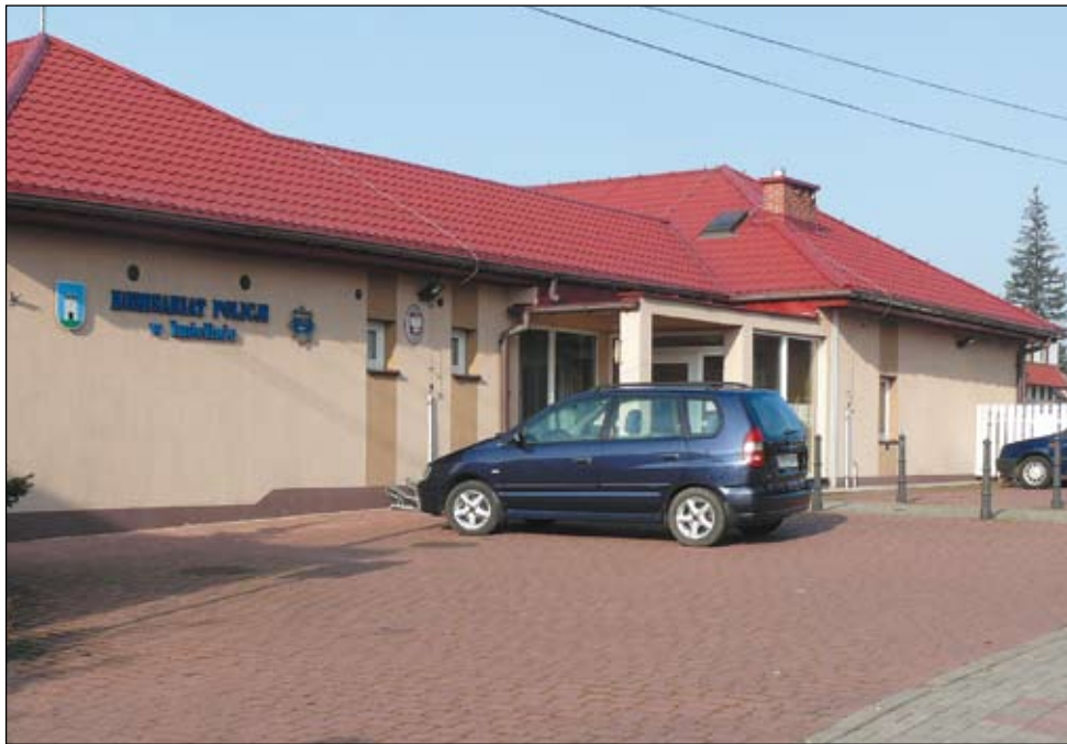
To, że placówka Policji w Imielinie nie jest komisariatem a posterunkiem, nie ma negatywnego znaczenia dla bezpieczeństwa mieszkańców.

Jeden z problemów bezpieczeństwa to liczba ofiar wypadków. Okazuje się, że nie ma jed-