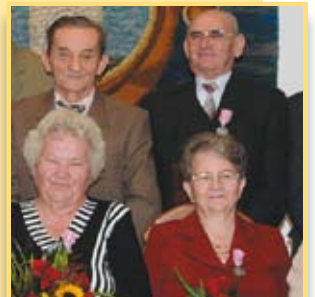
Złoci i diamentowi