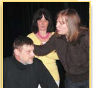
Kolejna premiera Komanderów