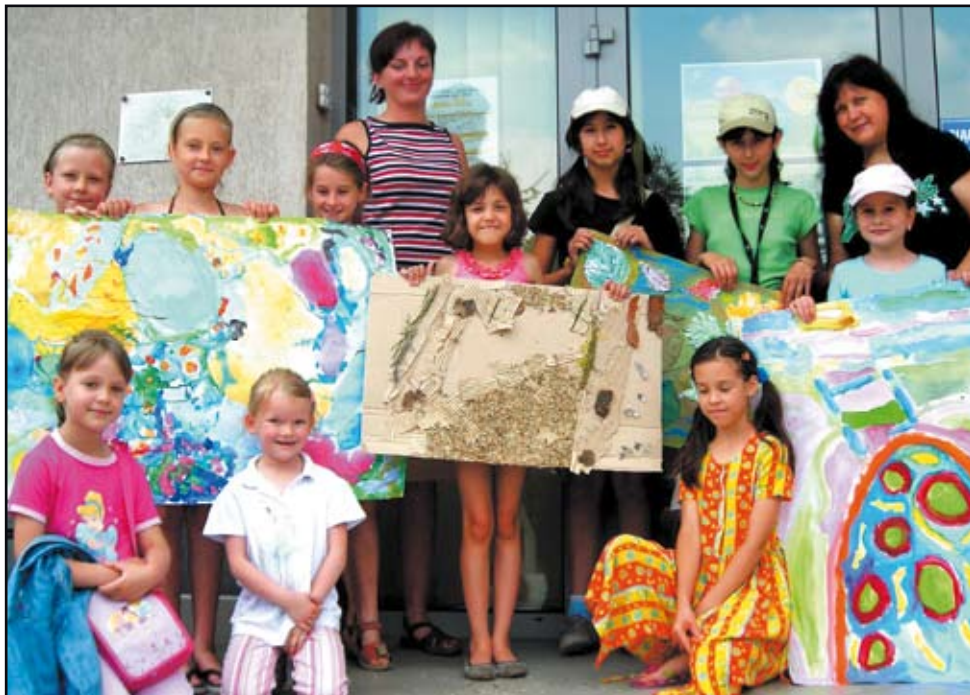
Uczestnicy warsztatów i ich prace - obok „art land” czyli sztuka ziemi

idea – osiągnięcie celów to radość, to świat pełen kolorów. Dzieci tworzyły malarskie kompozycje stosując kontrast kolorystyczny obrazujący umiejętność przewidywania przeciwności.