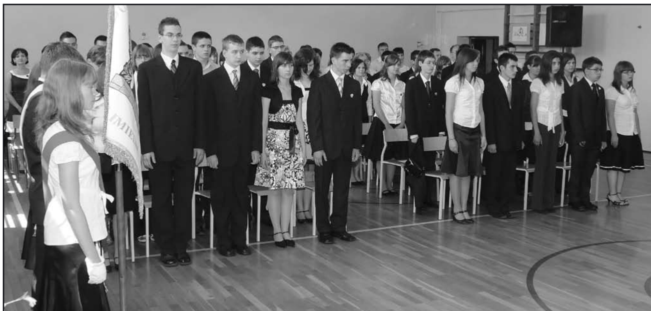
Podczas uroczystości zakończenia roku szkolnego w gimnazjum

Absolwenci zostali uhonorowani w trakcie uroczystej akademii w obecności rodziców, władz miasta i grona pedagogicznego. Wszyscy uczniowie otrzymali dyplomy ukończenia szkoły, a rodzice podziękowania za wzorowe wychowywanie swych pociech. Następnego dnia młodzież odebrała swoje świadectwa ukończenia nauki w gimnazjum, z którymi udała się do szkół średnich.