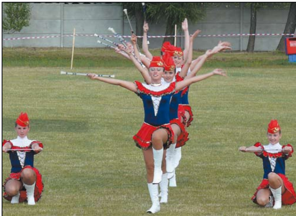
Jubileuszowe zawody ozdobił występ mażorettek

Podczas biegu przedszkolaków można było odnieść wrażenie, że odbywają się dwa biegi... ale jaka była radość na mecie!