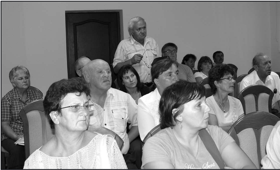
Mieszkańcy w tytułowej sprawie mieli kilka pytań...

Studium pokazuje, w którym kierunku miasto powinno się rozwijać – jak ma być zagospodarowane. W potocznym rozumieniu Studium to nic innego jak plan miasta wykonany w skali 1:10000 z naniesionymi obszarami przewidzianymi do zabudowy mieszkaniowej, usługowej, produkcyjnej, z podziałami na drogi i infrastrukturę oraz zieleń, rolę czy las.