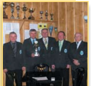
Awansowali do II ligi