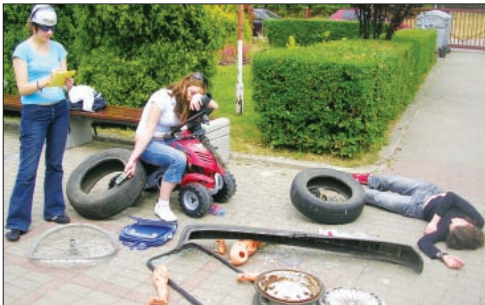
To na szczęście tylko zabawa

Rzut dziennikiem lekcyjnym lub beretem, slalom na nartach po trawie, czy też sztafeta z kubkiem wody, opisywanie marzeń, tworzenie autoportretu z kwiatów, kamieni czy trawy. To tylko przykłady tego, czym zajmowali się uczniowie