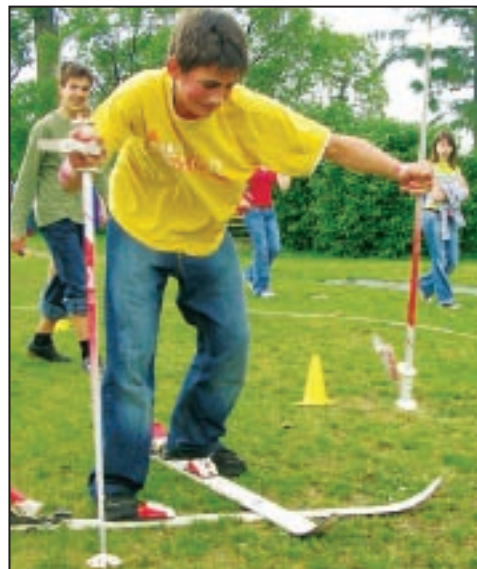
Zawody w Gimnazjum