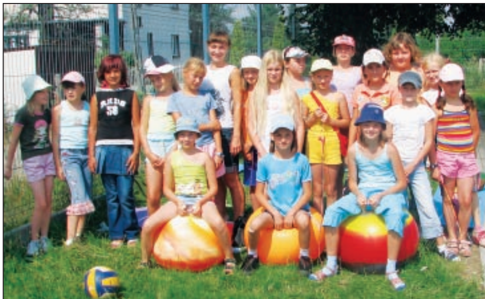
Uczestnicy półkolonii w Imielinie