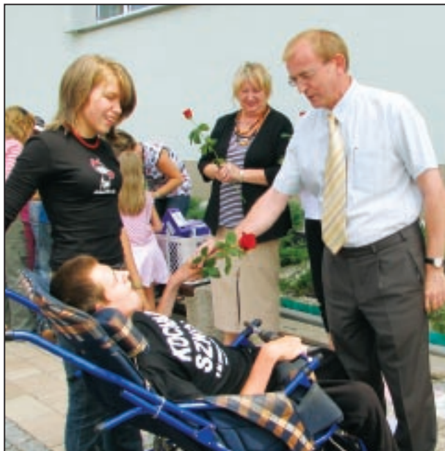
Półkolonie miały charakter integracyjny